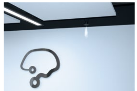
Condair HumiLife im Einsatz bei Digital Brain

Luftbefeuchtung, Entfeuchtung und Verdunstungskühlung