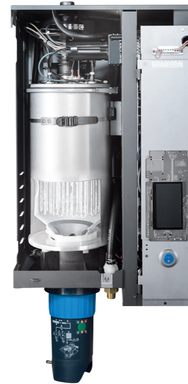
Kalk bildet sich auf Heizelementen