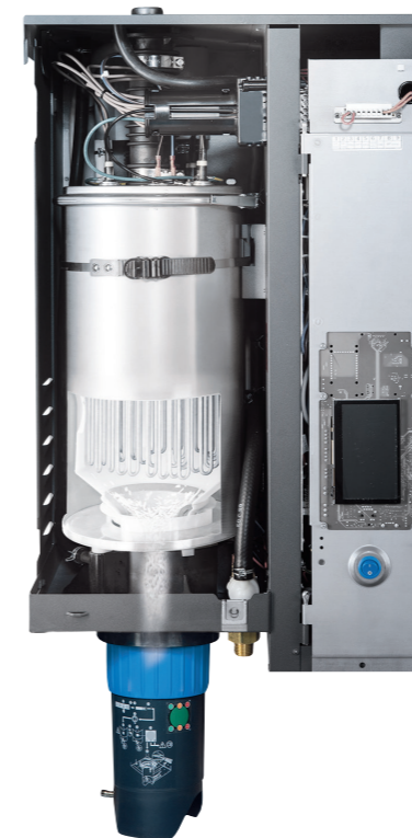
Kalk fällt in den Auffangbehälter