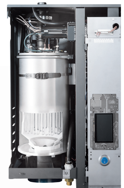
Kalk-Auffangbehälter wird geleert