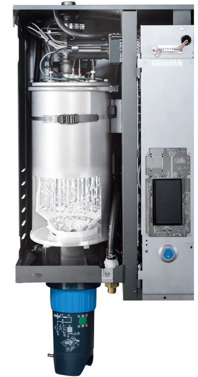
Kalk löst sich während des Heizzyklus