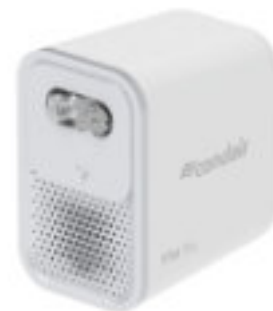
Vita Sky M2 (zwei Düsen)