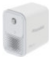
Vita Sky M1