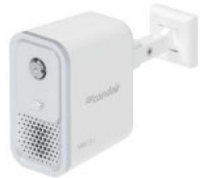
Einfache Wandmontage (für einen Kopf)