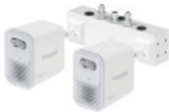
Wandmontage (für Vita Sky T bzw. zwei Köpfe)