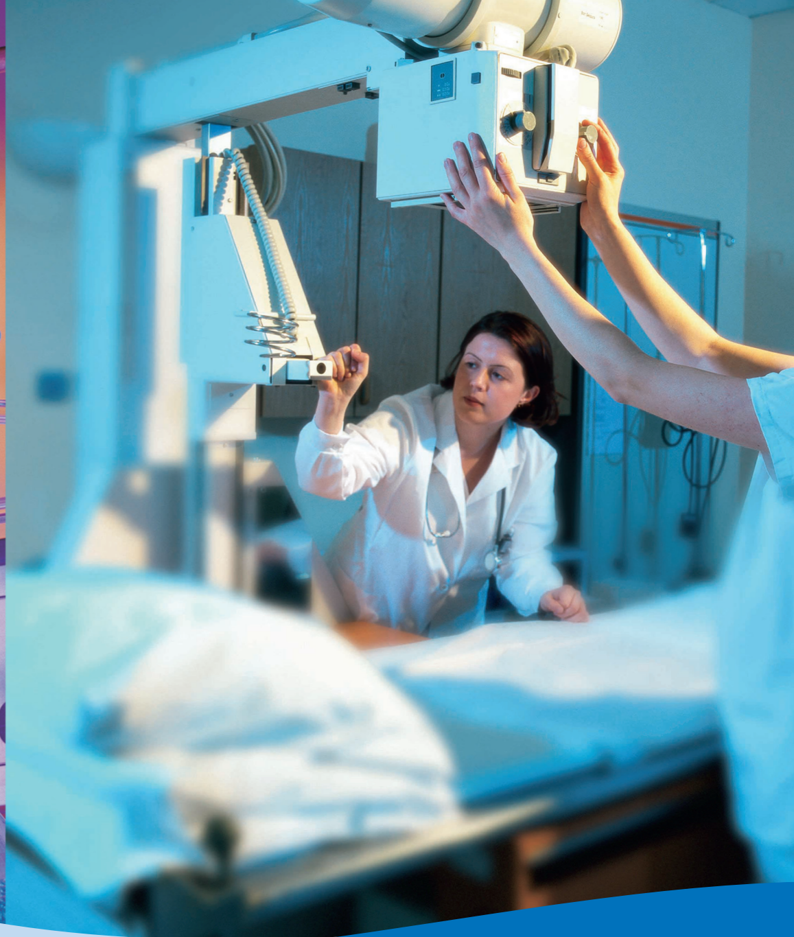
Condair PS 干蒸汽加湿器系统